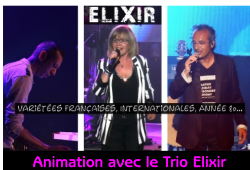
Animation avec le Trio Elixir

Salle des Cordulies au Havre d'Olonne à partir de 14H00